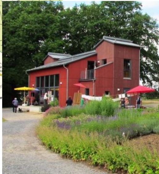
Das Rote Haus