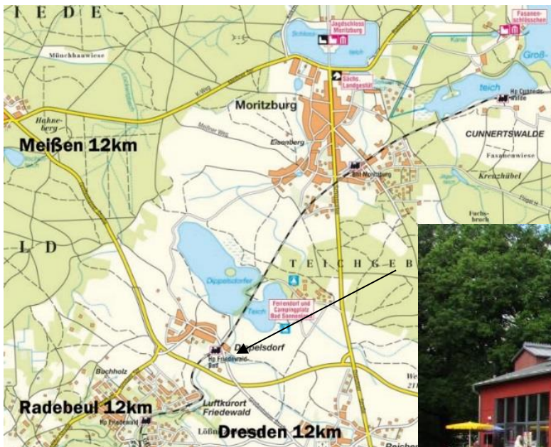
Lageplan „Rotes Haus“

Am Roten Haus, als Ort der Kunst, der Kultur und der gesunden Lebensart soll es gelingen, in vielfältiger Weise sinnbildliche Brücken zu bauen. Idyllisch in die Teichlandschaft von Moritzburg eingebettet, entwickelt sich hier eine Verbindung aus der Vergangenheit hin zur Gegenwart. Das um 1900 erbaute rote Badehaus und der markante Höhenzug am Südufer des Dippelsdorfer Teiches bestimmten einen Komplex von Zeichnungen und Gemälden der Künstler dieser Zeit. Vor diesem Hintergrund wurde das Rote Haus 2005 als Nachbildung des alten Badehauses errichtet.