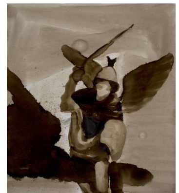
Arbeit von Rao Fu